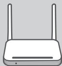
HSPA+ 3G SOHO 行動寬頻路由器 DWR-711